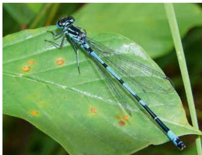
■ L'Agrion joli ( Coenagrion pulchellum ), classé "Vulnérable"

Cette perception dépend cependant du niveau actuel des connaissances et les lacunes d'inventaires observées laissent présager que certaines régions n'ont pas encore révélé tous leurs enjeux.