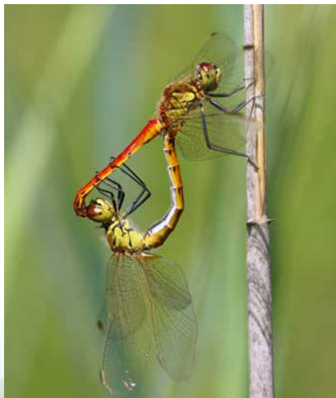
■ Accouplement de Sympétrum déprimé ( Sympetrum depressiusculum ), une espèce classée "En danger"

Face à cette situation, une vingtaine d'espèces de libellules bénéficie déjà d'un plan national d'actions, visant à développer les connaissances et à améliorer leur état de conservation. Au-delà de ces mesures à poursuivre, les réponses à apporter passent nécessairement par un renforcement de la préservation des zones humides, qui forment le milieu de vie de ces espèces et de toute une faune et une flore riches et diversifiées. La Liste rouge nationale contribuera à orienter les stratégies de connaissance et d'action pour atteindre ces objectifs de préservation.