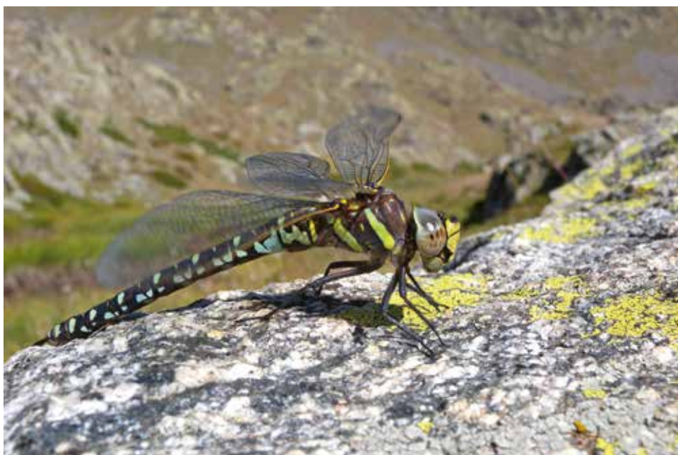
■ L'Aesche des joncs ( Aeshna juncea ), classée "Quasi menacée"

(*) Espèces présentes en métropole de manière occasionnelle ou marginale.