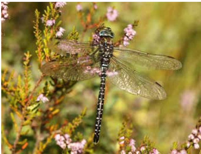
■ L'Aeshne subarctique ( Aeshna subarctica ), une espèce "Quasi menacée"

Finalement, 89 espèces ont donc été passées au crible des critères de la Liste rouge. Le bilan synthétique de ces évaluations est présenté ci-dessous et les résultats détaillés p. 9 et 10.